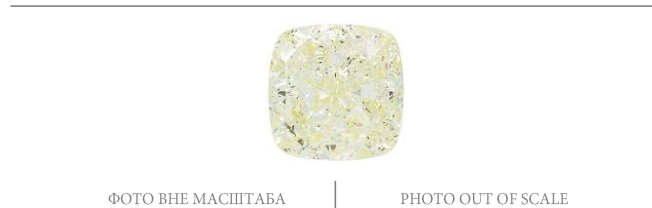
ФОТО ВНЕ МАСШТАБА

Грейнинг. Фацетированный рундист. Характеристики определены в соответствии с СТО 003.2023.